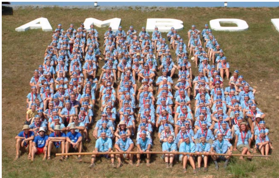
Suomen särmä joukkue Thai- maan jamboreella. Joukkuekuva otettiin 1.1.2003 paahtavassa hel- teessä Central Areenalla.